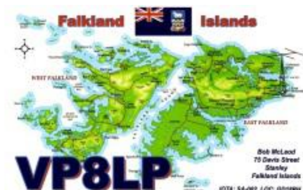
'19.10/29 06:18utc 14MHz FT4

ほとんど局との交信は、「73」を貰えますが、コンディションとQSBのために何回もやりとりして、残念ながら「73」を貰えず相手局のLogには乗らないことがあります。以上