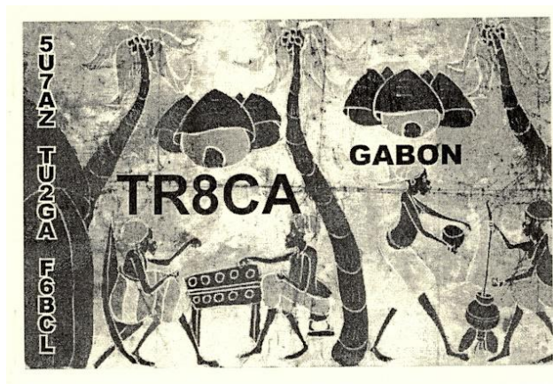
10/27 06:46utc 14MHz FT8