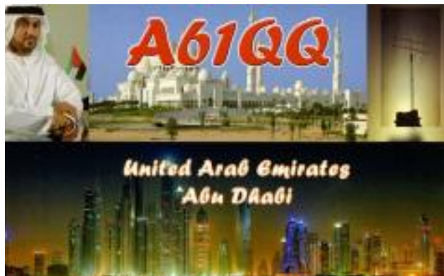
'19.11/23 04:49utc 14MHz FT8

コロナ禍の中、国際郵便停止国が多く思うようにQSLカードをもらえませんが、ネットとQRZ.COM（宛先またはマネージャー情報）を見ながら郵送可能な外国にSASEを送っています。