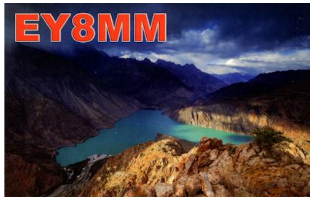
11/08 05:54utc 14MHz FT8